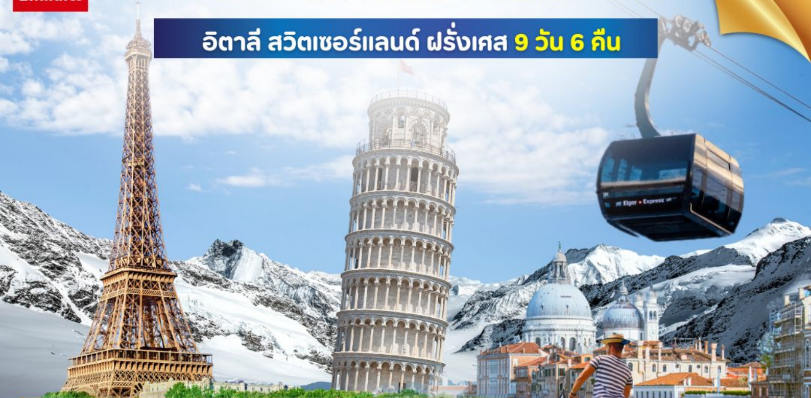
ยอดเขาจุงฟราว

อิตาลี สวิตเซอร์แลนด์ ฝรั่งเศส 9 วัน 6 คืน