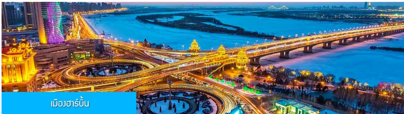
เมืองฮาร์บิน

หลังอาหารนำท่านเดินทางสู่ เมืองฮาร์บิน 哈尔滨市 (ระยะทาง 250 กม.ใช้เวลาเดินทางราว 3 ชั่วโมงเศษ) เมืองฮาร์บินเป็นเมืองที่ตั้งอยู่ทางตอนเหนือของจีนที่มีพรมแดนติดกับประเทศรัสเซีย เป็นเมืองเอกของมณฑล เฮยหลงเจียง มีสมญานามว่าเป็นกรุงมอสโกตะวันออก และได้ชื่อว่าเป็นเมืองหลวงแห่งฤดูหนาวเนื่องจากเมือง แห่งนี้มีช่วงฤดูหนาวยาวกว่าฤดูร้อน มีเทศกาลแกะสลักน้ำแข็งนานาชาติจัดขึ้นที่เมืองนี้ในช่วงฤดูหนาวของทุกปี เป็นจุดหมายปลายทางสำหรับนักท่องเที่ยวทั้งในและต่างประเทศที่ชื่นชอบความสวยงามของหิมะในฤดูหนาว