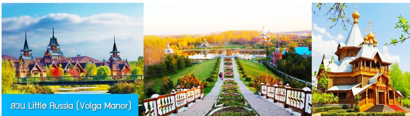
สวน Little Russia (Volga Manor)

หลังอาหารนำท่านเดินทางสู่ เมืองฮาร์บิน 哈尔滨市 (ระยะทาง 250 กม.ใช้เวลาเดินทางราว 3 ชั่วโมงเศษ) เมืองฮาร์บินเป็นเมืองที่ตั้งอยู่ทางตอนเหนือของจีนที่มีพรมแดนติดกับประเทศรัสเซีย เป็นเมืองเอกของมณฑล เฮยหลงเจียง มีสมญานามว่าเป็นกรุงมอสโกตะวันออก และได้ชื่อว่าเป็นเมืองหลวงแห่งฤดูหนาวเนื่องจากเมือง แห่งนี้มีช่วงฤดูหนาวยาวกว่าฤดูร้อน มีเทศกาลแกะสลักน้ำแข็งนานาชาติจัดขึ้นที่เมืองนี้ในช่วงฤดูหนาวของทุกปี เป็นจุดหมายปลายทางสำหรับนักท่องเที่ยวทั้งในและต่างประเทศที่ชื่นชอบความสวยงามของหิมะในฤดูหนาว