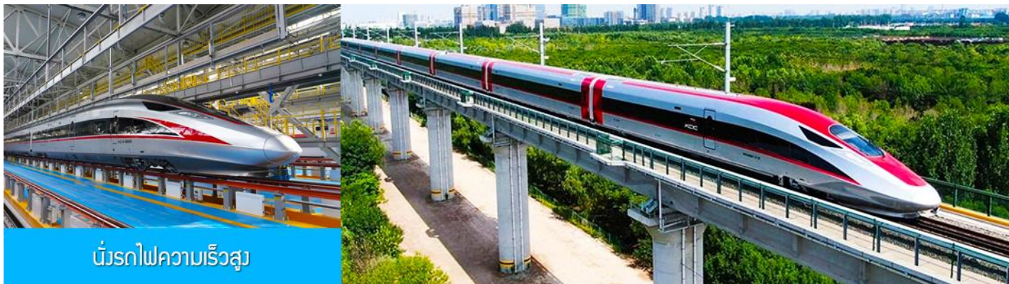
บัรรถไฟความเร็วสูง

14.05 น. นำท่านขึ้นรถไฟความเร็วสูงขบวนที่ G910 (14.05/18.46) เพื่อเดินทางไปยังกรุงปักกิ่ง 18.46 น. ขบวนรถไฟนำท่านเดินทางถึงกรุงปักกิ่ง นำท่านเดินทางโดยรถบัสภัตตาคาร เย็น รับประทานอาหารค่ำ ณ ภัตตาคาร (12) หลังอาหารนำท่านเดินทางสู่ สนามบินต้าชิง กรุงปักกิ่ง ทำการเช็คอิน โหลดสัมภาระก่อนขึ้นเครื่อง