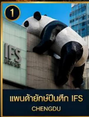
1 แพนด้ายักษ์ป็นตึก IFS CHENGDU