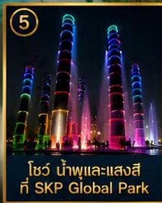
5 โซว น้ำพุและแสงสี ที่ SKP Global Park