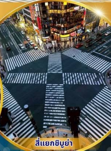
สี่แยกชิบูย่า