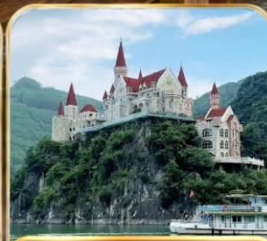
ล่องทะเลสาบว่านเฟิงหู