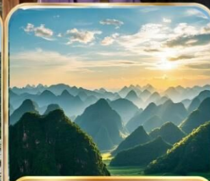
อุทยานป่าภูเขาหมื่นยอด (รวมรถแบตเตอร์รี่)