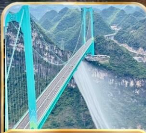
สะพานฮวาเกียง