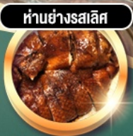
ห่านย่างสลีส