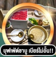
บุฟเฟ่ต์ชาบู เมียร์โมอัน!!