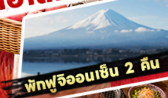
พักร้อนออนเซ็น 2 คืน