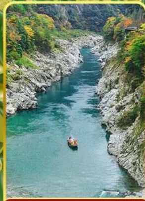
ล่องเรือช่องเขาโอโบเคะ