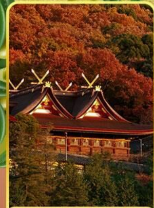
ศาลเจ้าคิบิฮิโกะ