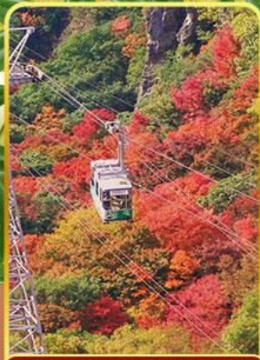
กระเช้าหุบเขาคังคาเคอิ