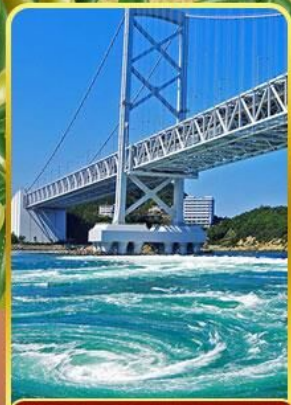
ช่องแคบนารุโตะ