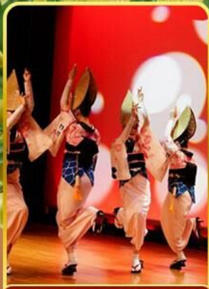
อะวะ โอะโตะริ โคคัง