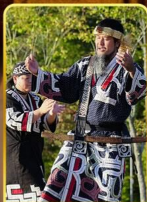
พิพิธภัณฑ์โอนู