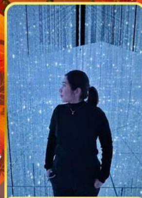
ทีมแอปโตเกียว