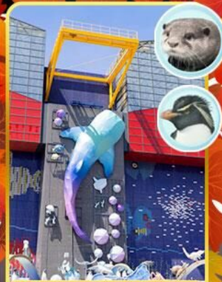
พิพิธภัณฑ์ไคยุคัง

🚿 ออนเซ็น 2 คั้น 🧳 นน.กระเป๋า 23 กก.X2 ☀️ 8Days 5Night