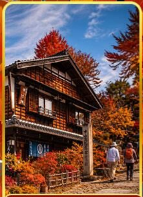
หมู่บ้านมาโกเมะจุกุ