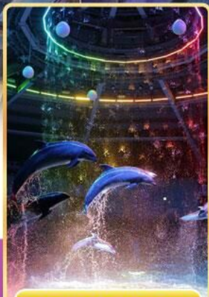
อควาพาร์ค ซินางาวะ