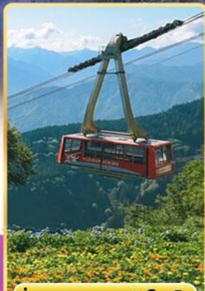
นั่งกระเช้าชูซาว่าโคเอ็น