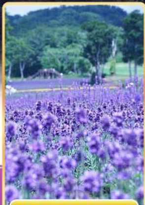
ทุ่งลาเวนเดอร์ทัมบาระ