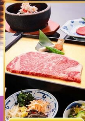
บุฟเฟ่ต์ ROKKASEN