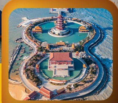
“แปดเซียนข้ามทะเล”

เสน่ห์เมืองชายฝั่งจีนตอนเหนือ • เวนิสตะวันออก • เก็บผลไม้ ณ สวนต้าเหลียน เมืองเหยียนโต • ท่าเรือโซ่ซาง ปลายวาฟกายตัน • เมืองเฝิงไห่ • แปดเซียนข้ามทะเล เมืองเว่ยไห่ • ถนนคนพลิงเลข 8 • ซากเรือบลูวู • Korean Town • หมู่บ้านซาจื่อโจว สะพานจันเฉียว • โบสถ์เซนต์ไมเคิล • พิพิธภัณฑ์เบียร์ซิงเต่า • อ่าวผู้ซานวาน