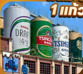
“พิพิธภัณฑ์เบียร์ซิงเต่า”

เสน่ห์เมืองชายฝั่งจีนตอนเหนือ • เวนิสตะวันออก • เก็บผลไม้ ณ สวนต้าเหลียน เมืองเหยียนโต • ท่าเรือโซ่ซาง ปลายวาฟกายตัน • เมืองเฝิงไห่ • แปดเซียนข้ามทะเล เมืองเว่ยไห่ • ถนนคนพลิงเลข 8 • ซากเรือบลูวู • Korean Town • หมู่บ้านซาจื่อโจว สะพานจันเฉียว • โบสถ์เซนต์ไมเคิล • พิพิธภัณฑ์เบียร์ซิงเต่า • อ่าวผู้ซานวาน