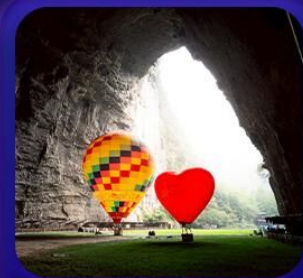
“ ถ้ำเกิ่งหลง ”