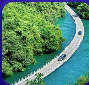
“ หุบเขาสิงโต ซื่อจื่อกวน ”