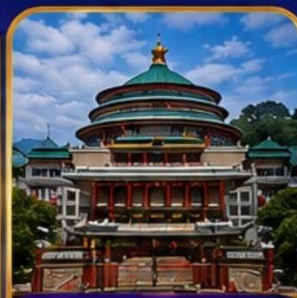
มหาศาลาประชาคมฉงชิ่ง