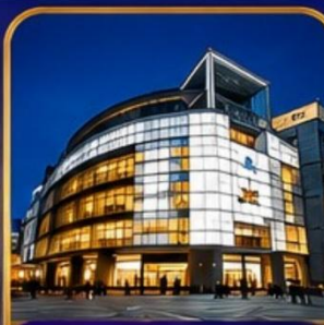
The Ring Mall