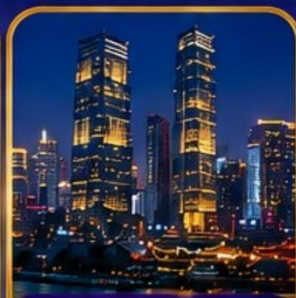
ตึกไควซิงไห่