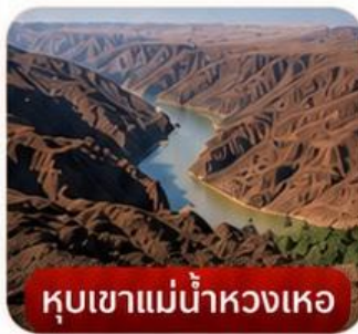
หุบเขาแม่น้ำหงเหอ