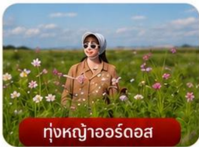
กู่หงุ้อออร์ดอส