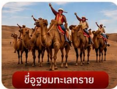
ขี้อูฐชมทะเลทราย