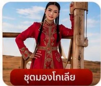
ชุดมองโกเลีย