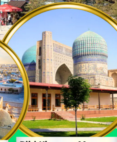
Bibi Khanym Mosque