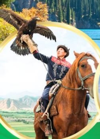
ชมโซว์นคอินทรีย์