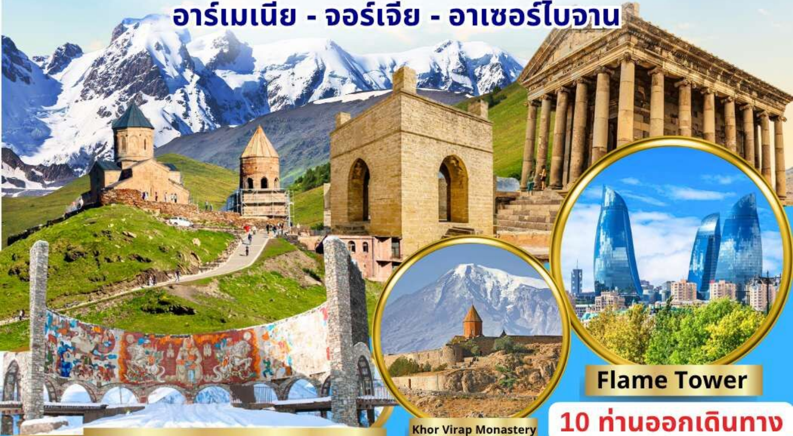
Georgian-Russian Friendship Monument