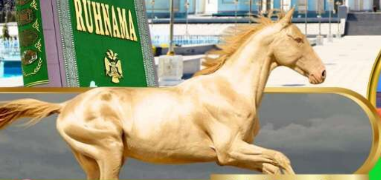
Akhal Teke Horse