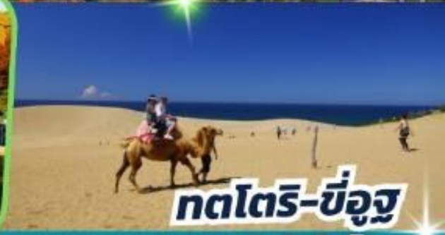
ทตโตริ-ซึอูซุ