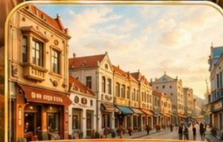
เมืองโบราณจี่โม Jimo Ancient Town