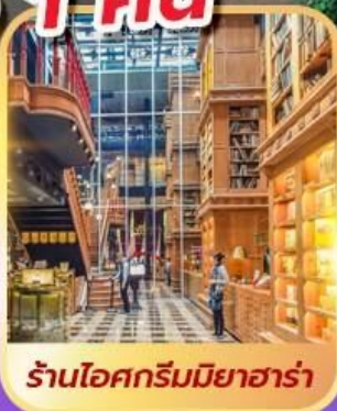
ร้านไอศกรีมมียาฮารา