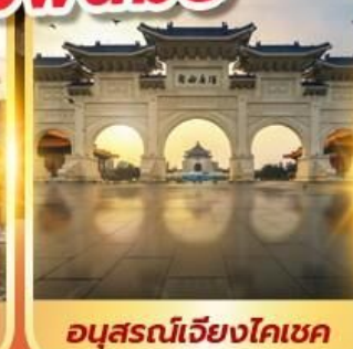
อนุสรณ์เจียงโตเซค