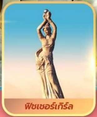
ฟิชเชอร์เกิร์ล