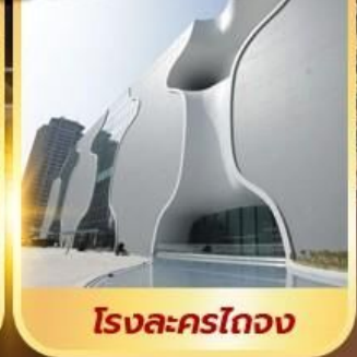
โรงละครไทจง