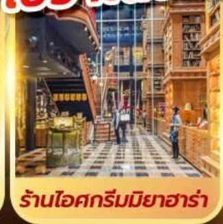
ร้านไอศกรีมมียาฮารา