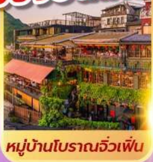
หมู่บ้านโบราณจิว่เฟิ่น