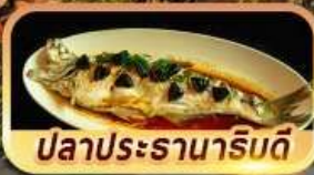
ปลาประรานาภิบดี