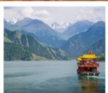
ช่องเรือทะเลสาบเทียนฉือ