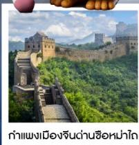
กำแพงเมืองจีนด่านซือหม่าไท่

เมืองโบราณกุ่เป่ย์ซู่ยจิน / กำแพงเมืองจีนด่านซือหม่าไท่ (รวมค่ากระเช้าขึ้น-ลง) / ชมวิวกำแพงเมืองจีนและเมืองโบราณ ยูนิเวอร์แซลปักกิ่ง (รวมค่าบัตรเข้า) / จัตุรัสเทียนอันเหมิน / พระราชวังโบราณกู้กง / หอบูชาเทียนถาน คาเฟ่กาแฟบ้านน้ำตาล (TANG FANG CAFE) / พระราชวังฤดูร้อนอวิ๋เหอหยวน / ย่านชานหลี่ถุน (POP MART) / ถนนคนเดินไท่กู่หลี่