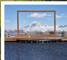
ปาหลางเจียงตู