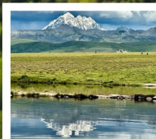
ดวงตาแห่งถ้ำกวง

หมู่บ้านทิเบตเจียงจวี • จุดชมวิวกูเซาซิมะหย่าลา • ปาเหม่ย สวนหินปาเหม่ย • จุดชมวิวดวงตาแห่งถ้ำกวง • วัดมู่หย่า หมู่บ้านเก๋ออี้หม่าซุน • ซินตูเจียง • หมู่บ้านกู่แงซุน หมู่บ้านปาหลางเจียงตู • เมืองลอยฟ้าเก๋อตี้ลามู่ • ภูเขาเจ๋อตัวซาน ถนนสายรุ้ง • ทะเลสาบแดง • ถนนคนเดินชอยกวางแคบ