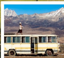
เมืองลอยฟ้าเก๋อตี้ลามู่

ทัวร์คุณธรรม ไม่ลงร้านช้อปปิ้ง ไม่ขายออฟชั่น