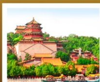
อวิ๋เหอหยวน