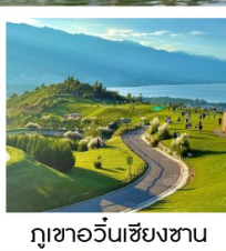
กุหาอวี่นเซียงซาน