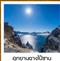
อุทยานอางไป่ซาน