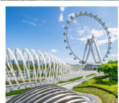
สวนสาธารณะ: OH BAY