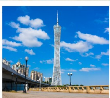
จัตุรัสฮัวเจิง