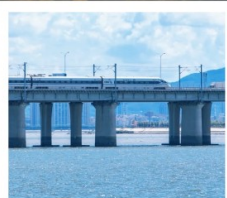
นั่งรถไฟใต้ดินข้ามทะเล