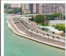
สะพานเหยียนหวู่เจียว