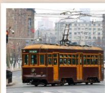
นั่งรถรางชมเมืองต้าเหลียน