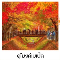
อุโมงค์เมบิชิ