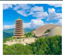
ภูเขาหนิวโล่วซาน

อุทยานทะเลสาบไท่หู (รวมล่องเรือ) ถนนคนเดินซานตง • วัดจีหมิง ถนนอุ๋งต๋าเต้า • ห้างสรรพสินค้าเต๋อจี ภูเขาหนิวโล่วซาน (รวมรถกอล์ฟ) สะพานแม่น้ำแยงซีเกียงนานกิง • ทะเลสาบเซวียนอู่ หมู่บ้านเหนียนฮวาวัน • โรงงานเซรามิกเถาอ้อด่าง เมืองโบราณเหย่าหู (รวมรถไฟเล็ก) • คุณซาน ถนนโบราณปาเจิง • North Bund Green Land STARBUCKS RESERVE ROASTERY THE LOUIS • ถนนหวยไห่ (SONG MONT)