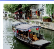
เมืองโบราณหนานผาน