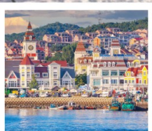
ท่าเรือประมงเขียนไก

เรือบลูวิส / ย่านฮั่นเล่อฟาง / ถนนฮั่วจวีปา ท่าเรือประมงเขียนไก / ย่านฮงโหว่ 1920 / ถนนโบราณเฉาหยาง หอคอยกาลเวลา / ชายหาดจินซา / รูปปั้นปลาวาฬ / หาดทรายซาจื่อฮั่ว หาดไซเบอร์ NO.3 / โรงงานเบียร์ชิงเต่า / โบสถ์ St. Emil ถนนคนเดินไต้ตง / สะพานจันเฉียว / จัตุรัส 54 / ห้าง MIXC