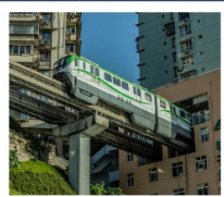
นั่งรถไฟทะลุติ๊ก