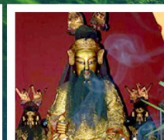
เซียงบู๊ซิว