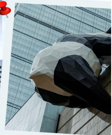
○ แพนด้ายักษ์ป็นติก