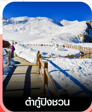
ต่ากู่ปิงชว่น