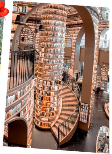
○ จัตุรัสหยางเทียนวู แพนด้าเซลฟี และ ห้องสมุดงูชูกอ