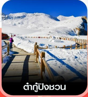
ต่ากู่ปิงชว่น