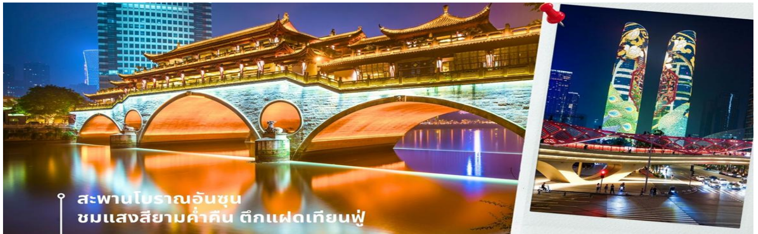
สะพานโบราณอันชุน ชมแสงสียามค่ำสิน ดึกแฝดเทียนฟู

นำท่านชม สะพานโบราณอันชุน-พร้อมชมแสงสียามค่ำสิน ดึกแฝดเทียนฟู เป็นสะพานข้ามคลองที่สร้างเป็นเหมือนอาคารอยู่ข้างบน ในช่วงเวลายามเย็นจะเป็นช่วงที่ผู้คนออกมาชมบรรยากาศบริเวณของสะพานแห่งนี้ และมีร้านค้ามากมาย รวมไปถึงบาร์เครื่องดื่มต่างๆ ที่ดึงดูดนักท่องเที่ยวได้เป็นอย่างดี เป็นสะพานที่ทอดข้ามแม่น้ำจินเจียง และเป็นรูปแบบสะพานมีหลังคา ตามลักษณะสถาปัตยกรรมจีนโบราณ อายุมากกว่า 300 ปี และในบริเวณใกล้เคียงยังเป็นที่ตั้งของ ดึกแฝดเทียนฟู โดยในช่วงค่ำเวลา ประมาณ 19.00-22.00 น. ทั้ง 2 ดึกจะเป็นไฟ LED สวยงามโดดเด่นมาก ดึกแฝดเทียนฟู หรือที่เรียกอย่างเป็นทางการว่าตึกศูนย์การเงินนานาชาติเทียนฟู เป็นตึกกระจาที่สวยงามโดดเด่นสองตึกในย่านการเงินของเฉิงตู ดึกแต่ละตึกมีความสูง 58 ชั้นและสูงกว่า 700 ฟุต ดึกเหล่านี้โดดเด่นเป็นพิเศษด้วยภายนอกที่หุ้มด้วยไฟ LED ที่เป็นเอกลักษณ์ ซึ่งเปลี่ยนอาคารให้กลายเป็นจอภาพดิจิทัลขนาดใหญ่