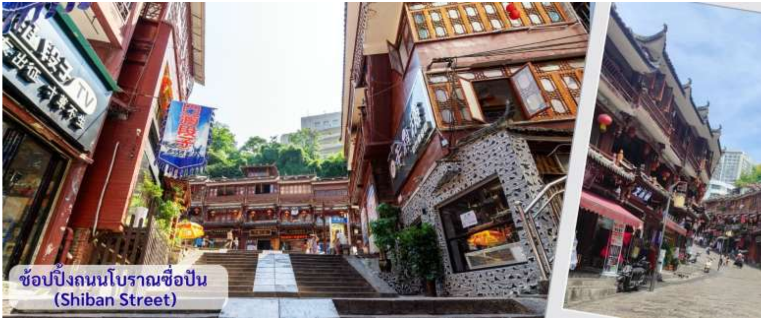
ช้อปปิ้งถนนโบราณช้อปปิ้ง (Shibanshi Street)

จากนั้นนำทุกท่าน เดินถนนโบราณ Feng Huang Ancient Town ที่ถนนช้อปปิ้ง Shibanshi Street เมืองที่ยังคงรักษาเอกลักษณ์ความเป็นพื้นเมืองผสมผสานกับยุคปัจจุบันเอาไว้ได้อย่างลงตัววิถีชีวิตของชาวบ้านที่อาศัยอยู่ที่นี่ บรรยากาศในเมืองเฟิงหวาง ถนนเก่าช้อปปิ้งเป็นถนนปูหินแคบๆ กว้างไม่ถึง 5 เมตร ทอดยาวจากทางเข้าวัดเต้าเหมินไปทางทิศตะวันตกผ่านถนนหลายสาย ได้แก่ ถนนครอส ถนนเจิ้งตวันออก ถนนเจิ้งตวันตง ศาลาฮุยหลง หียงเซียวชง เต้าชานลา ศาลาเจี้ยกัว และสุสานเซินฉงเหวิน สุดท้ายจะนำไปสู่ “น้ำพุแรกใต้ฟ้า” ถนนสายนี้มีความยาวกว่า 3,000 เมตร และเป็นย่านการค้าที่คึกคักที่สุดในเฟิงหวาง