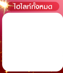
ไอโลกทั้งหมด