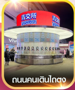
ถนนคนเดินไท่ตง