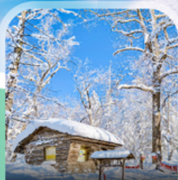
ภาพวาดสีบลู