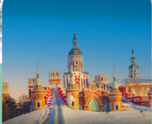
คฤหาสน์วอลก้า