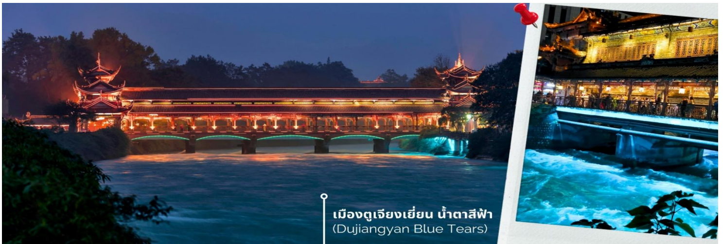
เมืองตูเจียงเยียน น้ำตาสีฟ้า (Dujiangyan Blue Tears)