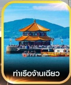
ท่าเรือฉางเฉียว