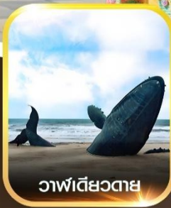
วาฬเดี่ยวตาย

คอนเฟิร์มออกเดินทาง ทุกพีเรียด 2 ท่านขึ้นไป