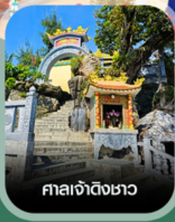
ศาลเจ้าดิ้งซาอว

เช็คอินสวนสนุก VinWonders ใหญ่ที่สุดของเวียดนาม นั่งกระเช้าชมวิวข้ามทะเล สวนสนุกออนเท็ม ตื่นตาอควาเรียมรูปเต่า อาณาจักรสัตว์น้ำ